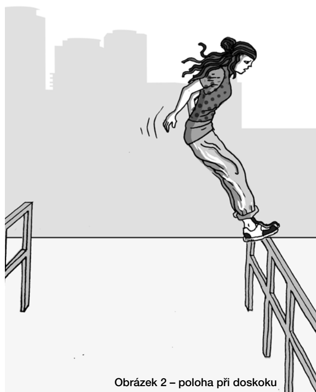
Obrázek 2 – poloha při doskoku