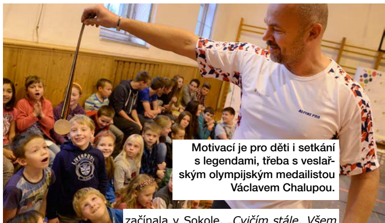
Motivací je pro děti i setkání s legendami, třeba s veslařským olympijským medailistou Václavem Chaloupou.

okolí věnovat. „Z naší zkušenosti mají vysvědčení největší přínos pro rodiče, protože jim pomohou odhalit silné stránky jejich dítěte a doporučí pro něj ty pravé sporty. Takové, které budou rozvíjet jeho přirozený talent a budou mu celoživotně přinášet radost a potěšení,“ uvedl Martin Jahoda ze SportAnalytik.