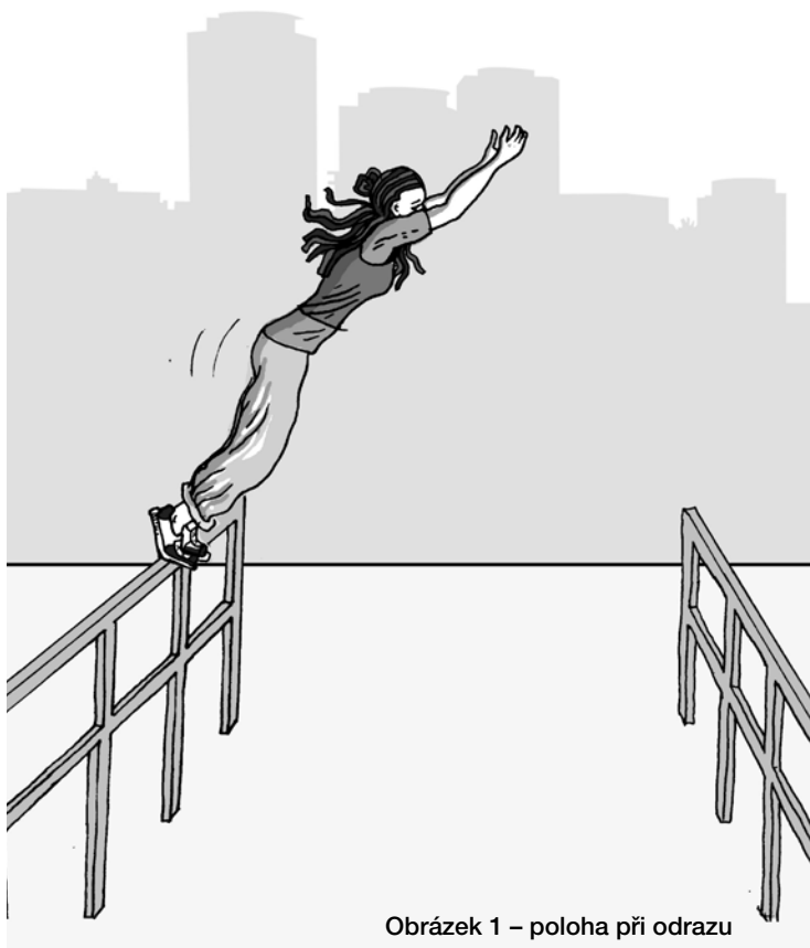
Obrázek 1 – poloha při odrazu