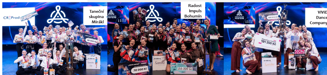
GALAVEČER „MISTR MISTRŮ 2023“ CZECH DANCE MASTERS 28. 5. 2023 - Kongresové centrum Praha CDO

„MISTR MISTRŮ 2023“ absolutní vítěz v kategorii DĚTI, JUNIOŘI, DOSPĚLÍ