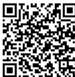
MČR Nové Město nad Metují 2025