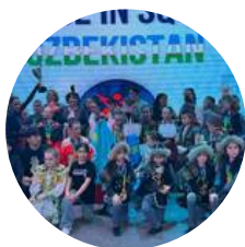
Taškent, Uzbekistan, International Championship