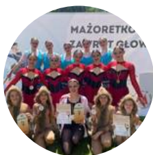
Racibórz, Polsko, Mažoretkowy Zawrot Glówy