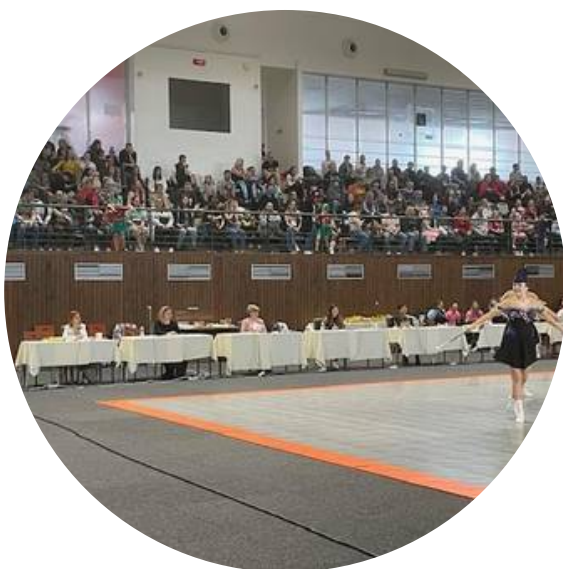
Pohled na část tribuny, Stochov