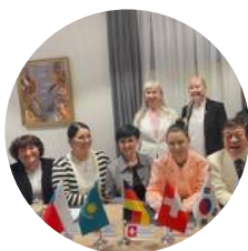
Kongres o mažoretkovém sportu Taškent, Uzbekistan